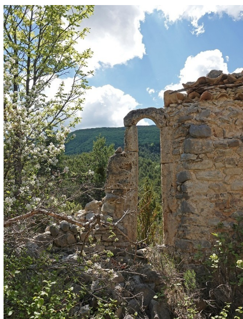
La chapelle St Sauveur : un projet de chantier participatif qui a démarré au 1er mai dernier. Voir p. 5