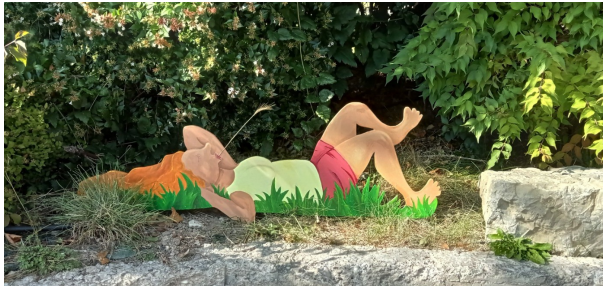
Des figurines en bois pour illustrer lieux et activités du village...

Le mercredi 1er septembre, les villageois étaient conviés au "goûter-vernissage" des premières figurines réalisées aux ateliers créatifs de la Commission Vie du Village. Depuis le mois d'avril dernier, une dizaine de personnes, toutes